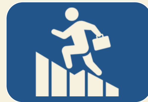
④ 営業支援 システム