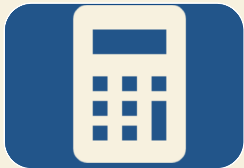
① 保険料試算 計上システム