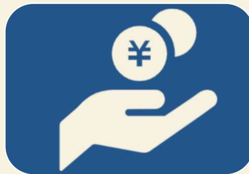
③ 代理店手数料 管理システム